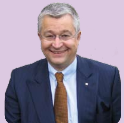
Vice-premier Guy Vanhengel

"Het is een sociale strijd die we ter harte nemen."